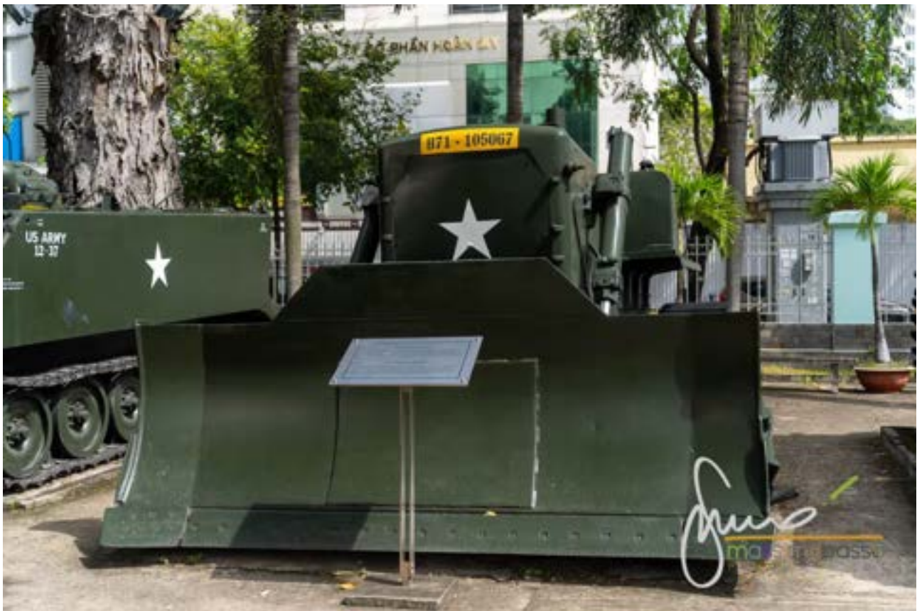
Musei delle vestigia della guerra - War Remnants Museum

Fra di queste mi ha colpito il Bulldozer. Nel 1969 in Vietnam c'erano 1.417 Bulldozer americani. In Vietnam erano usati per radere al suolo foreste, giardini, villaggi e risaie, in buona sostanza per affamare la popolazione. Non penso che si debbano aggiungere considerazioni, ma forse val la pena di riflettere sui crimini di guerra e su cos'è il significato della parola giustizia, a seconda della bocca che la pronuncia.