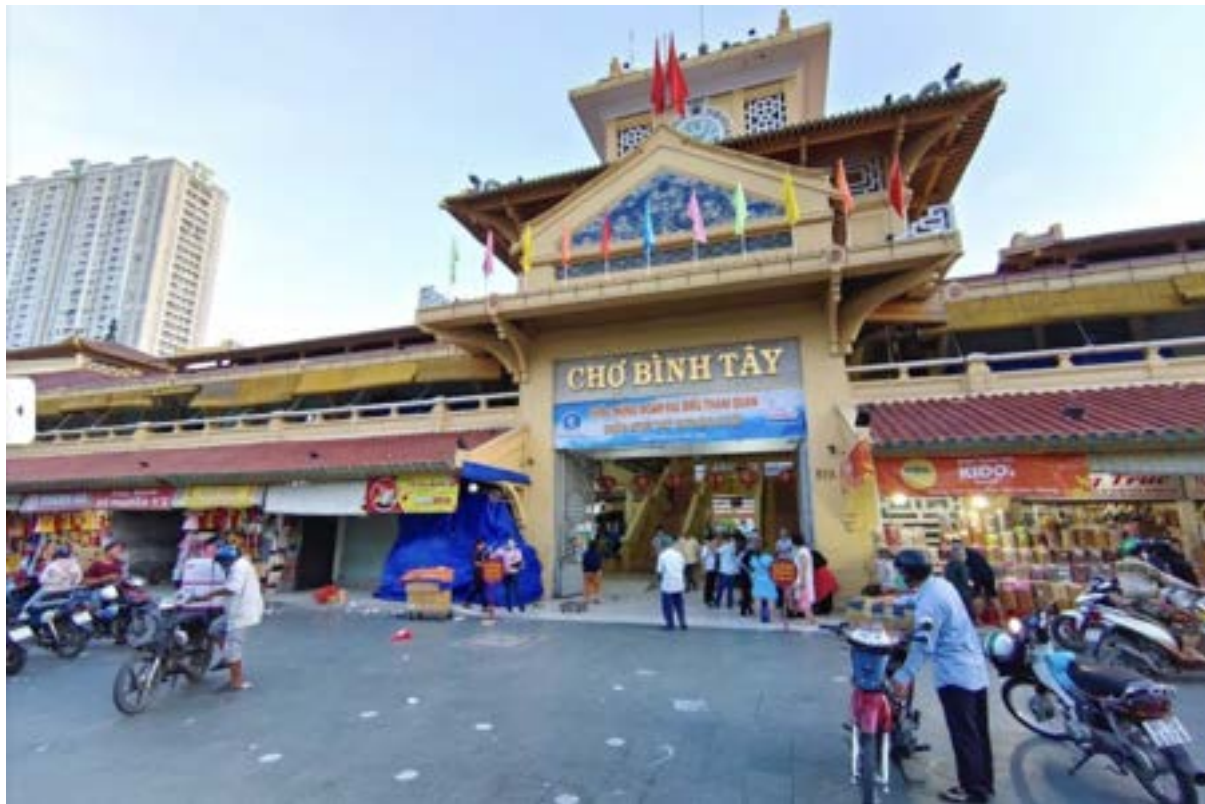
Mercato di Binh Tay o Binh Tay Market

La principale caratteristica del quartiere è insita nel nome stesso. Cho Lon in vietnamita significa grande mercato ed il mercato di Binh Tay fa onore al suo nome.