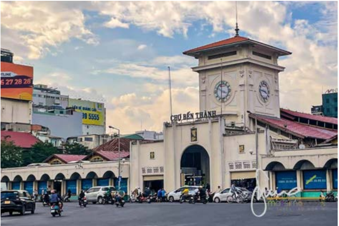
Mercato di Ben Thanh - Cho Ben Thanh