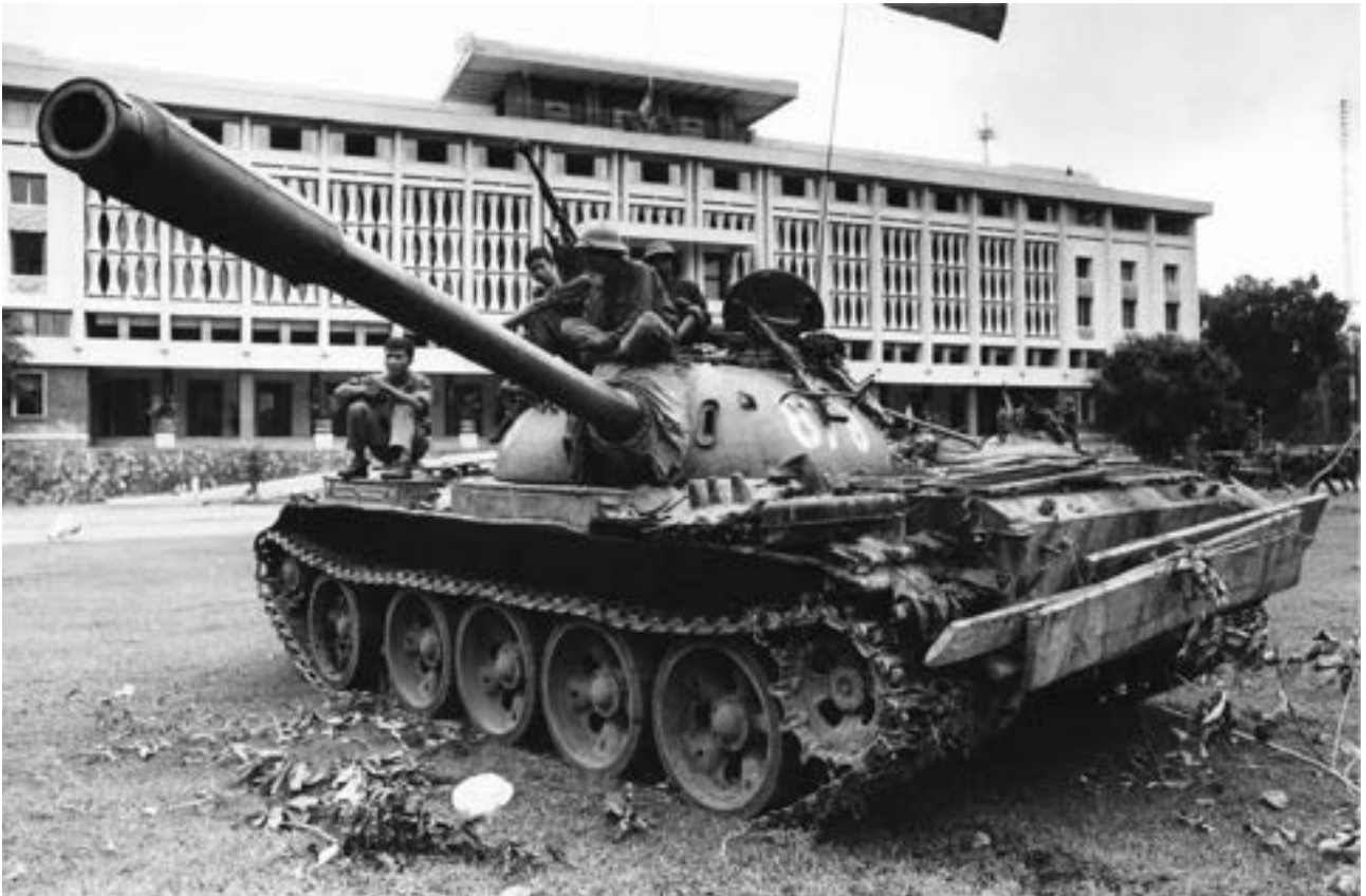
Immagine storica di un Carro armato dentro la sede del Palazzo della Riunificazione durante la presa di Saigon