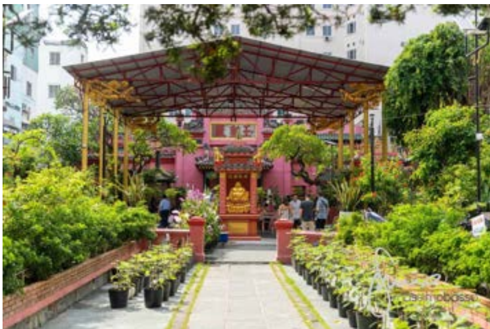
Pagoda dell'Imperatore di Giada - Jade Emperor's Pagoda

Web: https://en.wikipedia.org/wiki/Jade_Emperor_Pagoda