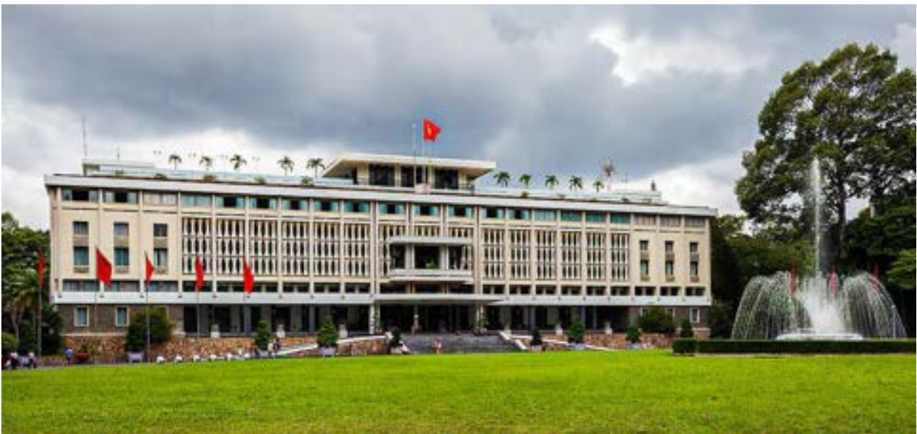
Palazzo della Riunificazione di Ho Chi Minh City di Diego Delso, CC BY-SA 3.0

In seguito al Golpe del 1962, il palazzo fu distrutto da un attentato e sulle sue macerie i nuovi governanti eressero la nuova costruzione.