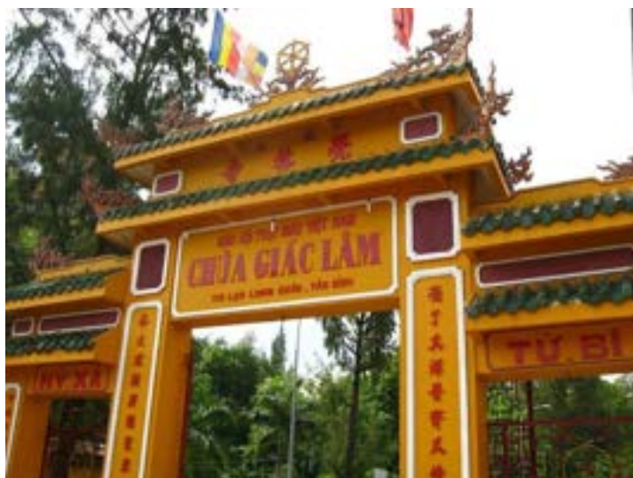
Pagoda Giac Lam Ingresso Sud

Superato il cancello principale si entra nel giardino, che è dominato da una grande statua del bodhisattva Avalokiteshvara, il bodhisattva della Compassione sotto l'albero della bodhi - l'Albero dell'Illuminazione o del Risveglio