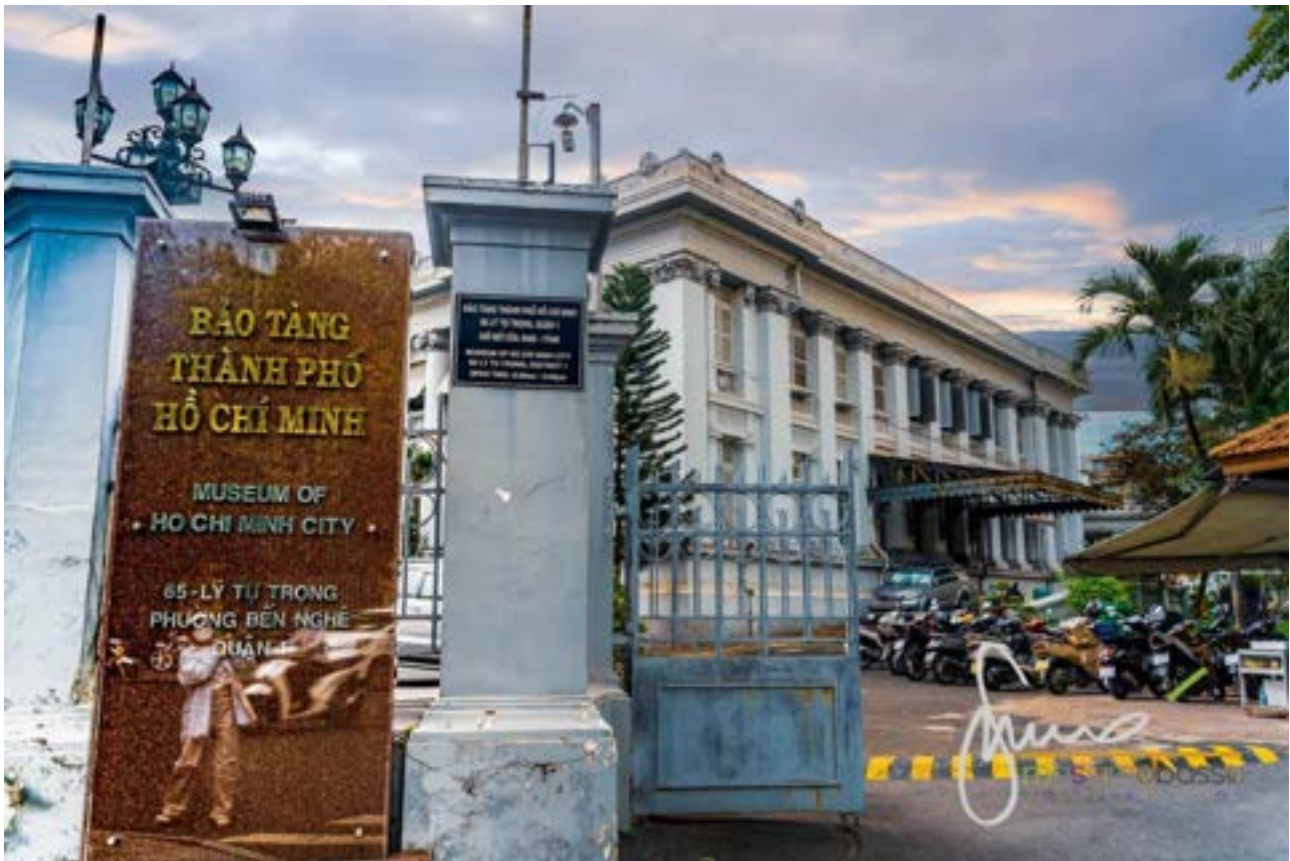
Museo di Ho Chi Min City - Palazzo Gia Long