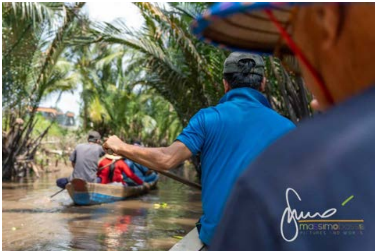
Escursione in canoa nel Delta del Mekong

Potete prenotare da qui il tour del Delta del Mekong e della Pagoda di Vinh Trang , ma, se avete più tempo consiglio e più disponibilità di denaro, un tour di due giorni o un tour privato.