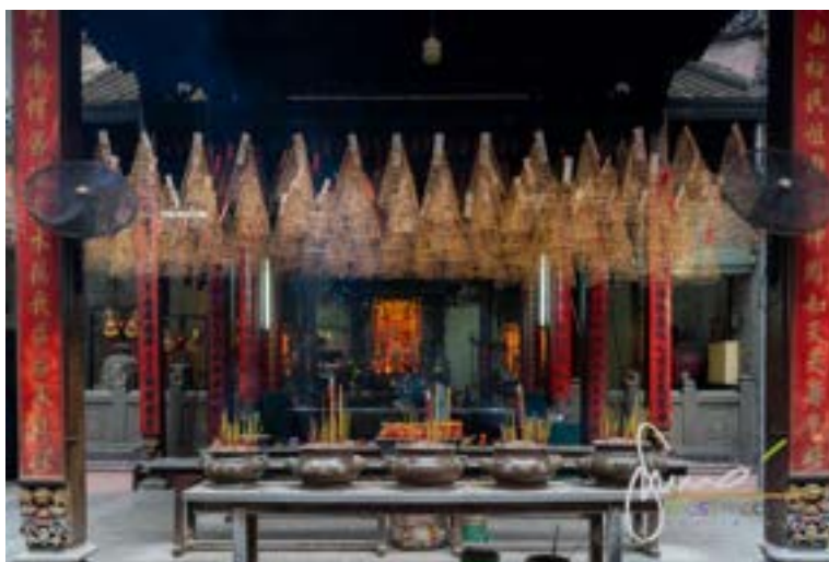
Pagoda Ba Thien Hau

La festa di Thien Hau si tiene il 23mo giorno del terzo mese del calendario lunisolare Cinese ed è una delle festività più sentite della comunità.