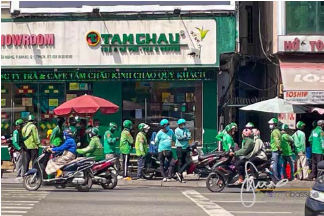
Autisti di GRAB a Saigon Ho Chi Minh City