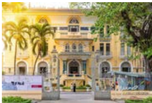
Museo delle belle arti - Ho Chi Minh City Museum of Fine Arts

Non c'è da aspettarsi un museo in stile europeo, ma sicuramente una bella esperienza. Terminata la visita al museo si può percorrere la vicina Duong Le Cong Kieu , una via con tanti negozi di antiquariato , dove tra cianfrusaglie e oggetti antichi si respira l'aria della vecchia Saigon.