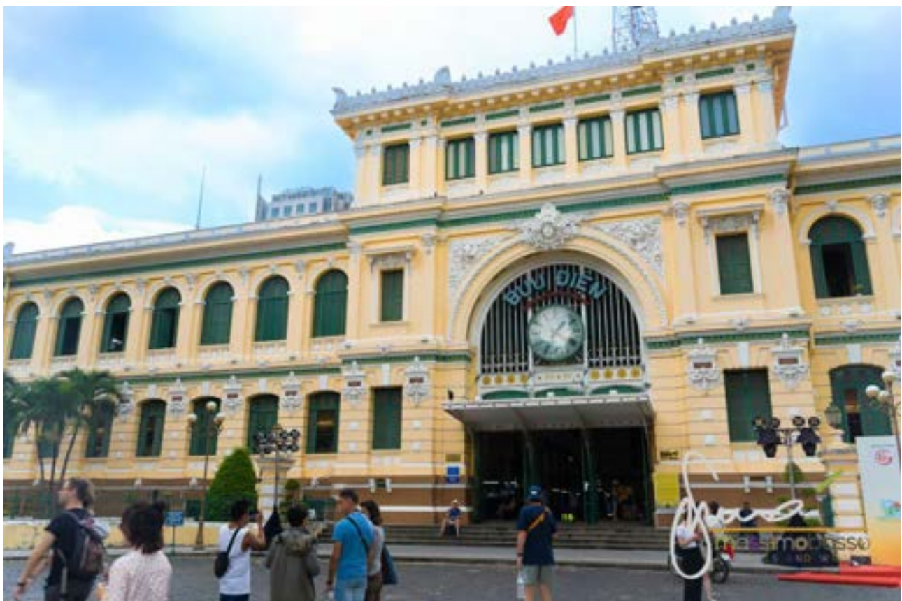
Ufficio Centrale delle Poste di Saigon Ho Chi Minh City

Web: http://hcmpost.vn/ (in inglese funziona male) https://en.wikipedia.org/wiki/Saigon_Central_Post_Office#cite_note-3